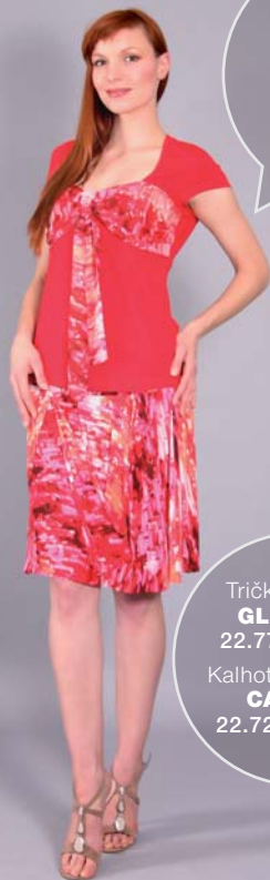
Tričko I T-Shirt GLAMOUR 22.77225.0191