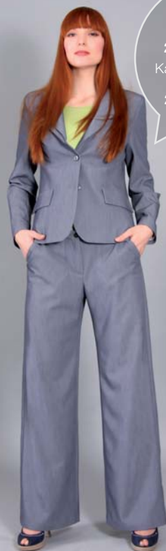
Sako I Jacket GIMI 22.73078.0311 Kalhoty I Trousers CAMPUR 22.72144.0311