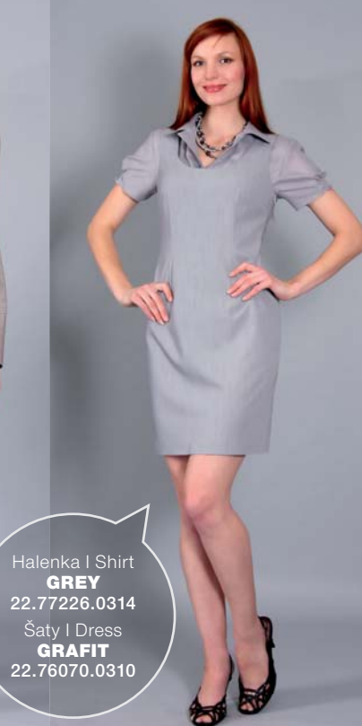
Halenka I Shirt GREY 22.77226.0314 Šaty I Dress GRAFIT 22.76070.0310

Praktický materiál který jsme pro vás vybrali na kostýmy a šaty lze prát v pračce. Díky svému složení rychle schne a je velmi nenáročný na žehlení. Modely vyrábíme v modré, fialové a šedé barvě. V nabídce je také károvaný vzor.