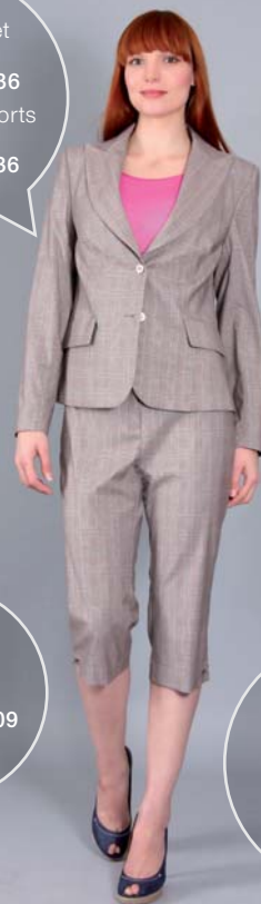
Sako I Jacket GIMI 22.73078.0336 ¾ Kalhoty I Shorts GREUTE 22.72158.0336