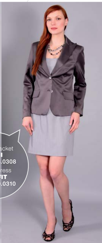
Sako I Jacket GIMI 22.73078.0308 Šaty I Dress GRAFIT 22.76070.0310