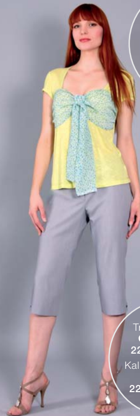
Tričko I T-Shirt GLAMOUR 22.77225.0327