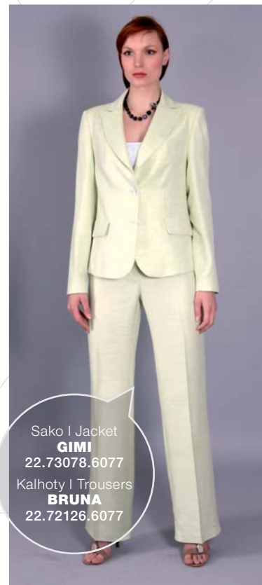
Sako I Jacket GIMI 22.73078.6077 Kalhoty I Trousers BRUNA 22.72126.6077