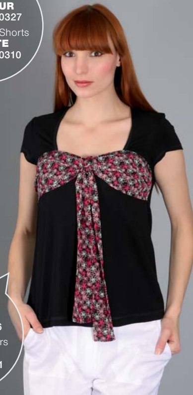
Tričko I T-Shirt GLAMOUR 22.77225.0156