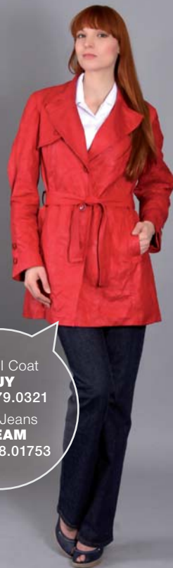
Kabát I Coat GUY 22.73079.0321 Rifle I Jeans DREAM 19.72148.01753