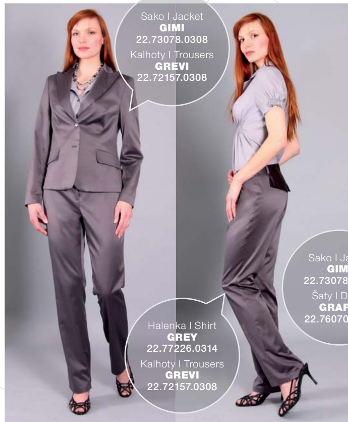
Sako I Jacket GIMI 22.73078.0308 Kalhoty I Trousers GREVI 22.72157.0308