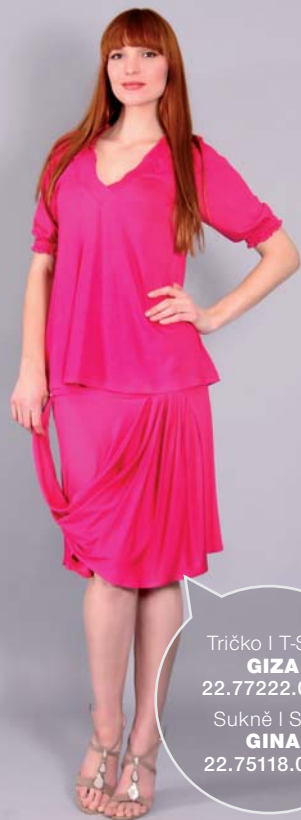
Tričko I T-Shirt GIZA 22.77222.0297 Sukně I Skirt GINA 22.75118.0297