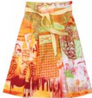
Sukně | Skirt EASTON 20.75099.5390