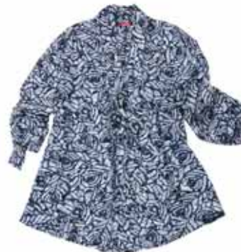
Kabátek I Spencer EMINENCE 20.73066.0256