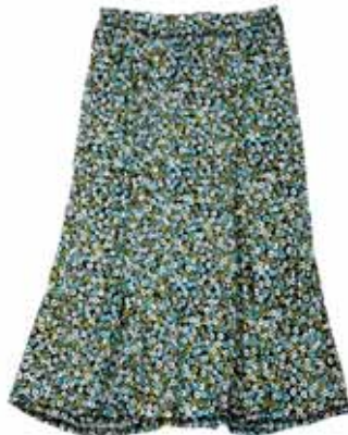
Sukně | Skirt CAPELINI 20.75085.0258