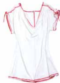
Tričko | T-Shirt ELBRA 20.77193.0098