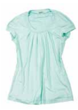
Tričko | T-Shirt ELLEN 20.77189.0068

Zvýšený pas podtrhující smyslné ženské tvary, zvýrazněná ramena, vzpomínáte? Inspirací k nové letní kolekci byla 80.a 90. léta. Tento trend se v náznamech promítá také do střihů triček s pružnými lemy. U sukní a šatů se snažíme uspokojit individuální nároky zákaznic. Vazačky z vlastního materiálu je totiž možné uvázat různými způsoby a tvořit tak neotřelé originální variace zcela podle aktuální nálady.