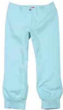
3/4Kalhoty | Shorts EDEN 20.72151.1931