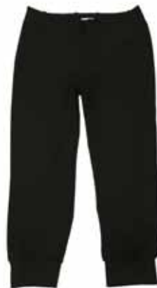
3|4Kalhoty | Pants EDEN 20.72151.2007