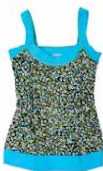
Tričko | T-Shirt ELEMENT 20.77190.0258