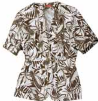
Sako I Jacket EMA 20.73065.0262