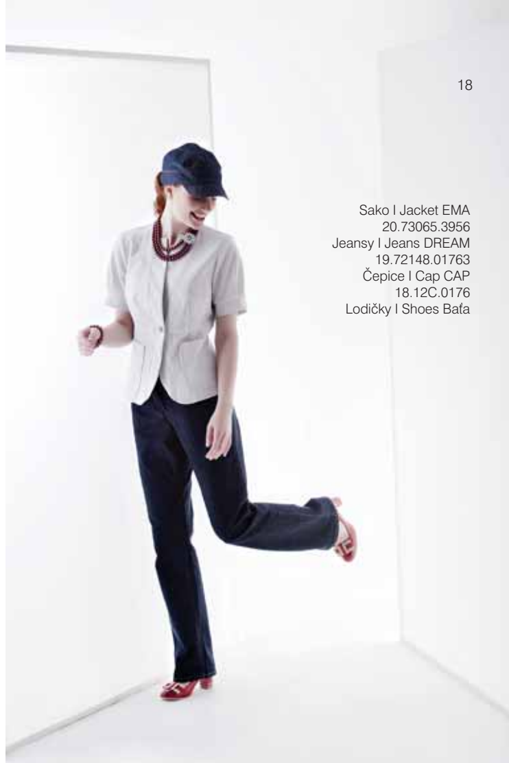
Sako | Jacket EMA 20.73065.3956 Jeansy | Jeans DREAM 19.72148.01763 Čepice | Cap CAP 18.12C.0176 Lodičky | Shoes Baťa