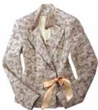
Sako I Jacket HALLE 20.73067.0264

Bižuterie se bude letos v létě používat méně. Půjde ale o velké, dominantní kusy. Jedná se především o masivní náramky nebo jejich mnohonásobné vrstvení, výrazné náušnice (až 15cm dlouhé), nebo nápadné prsteny. Voda a vzduch jsou klíčovými inspiracemi pro letní sezónu. Barvy ztělesňují beztlížnou lehkost a gradují do super neutrálních odstínů - krystal, šedý a bílý opál. Dále se budou používat přírodní tóny mědi, jantaru, hnědého ebenu, intenzivní červená a modrý opál.