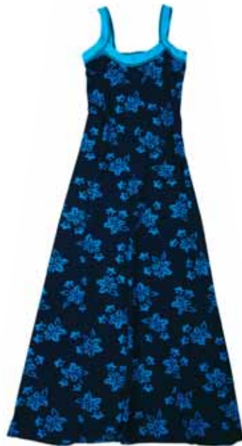
Šaty | Dress ELISE-L 20.76056.4106