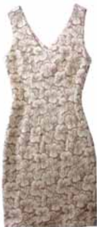
Šaty I Dress LOCHRISTI 20.76059.0264