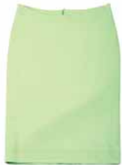
Sukně | Skirt BOIRY 20.75102.1933