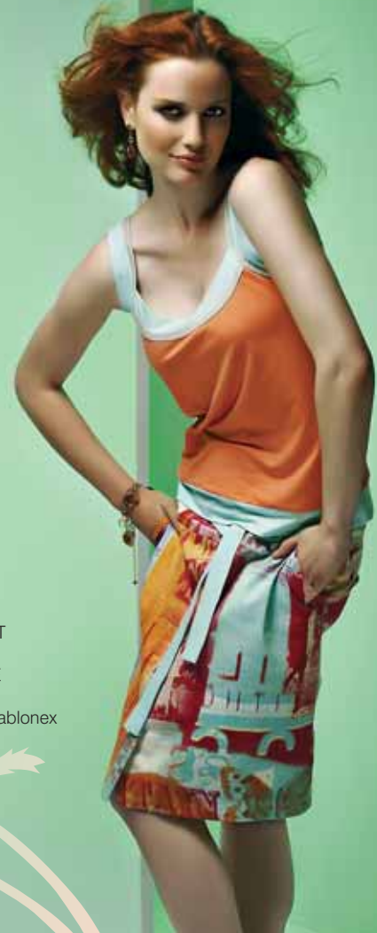
Tílko | Top ELEMENT 20.77190.0067 Sukně | Skirt EAGLE 20.75098.5391 Šperky | Jewellery Jablonex