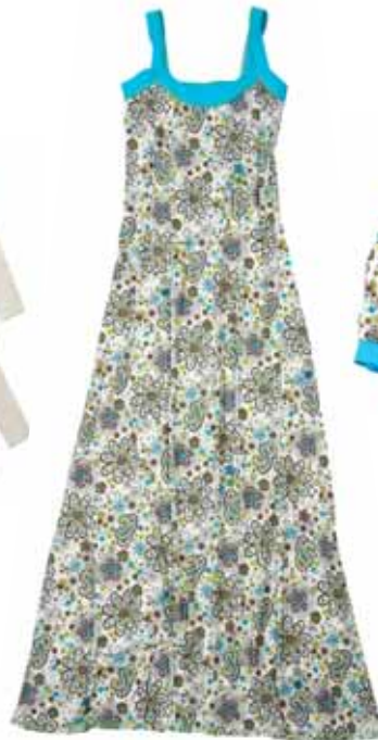
Šaty | Dress ELISE-L 20.76056.0185