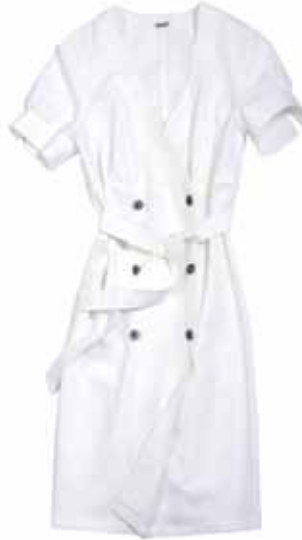
Šaty | Dress ELLA 20.76057.01241

Kabátek | Spencer EMINENCE 20.73066.01241 Kalhoty | Trousers CAMPUR 20.72144.01241 Boty | Shoes Bafa Šperky | Jewellery Jablonex