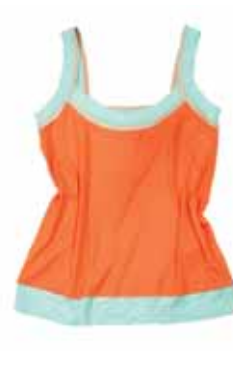
Tílko | Top ELEMENT 20.77190.0067