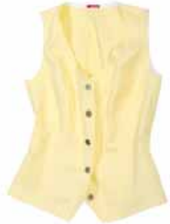
Vesta | Whist ENKORE 20.71012.1934

High waist stressing the sexy figure of a woman, accented shoulders, do you remember? 1980s and 1990s were the inspiration for the new summer collection. There are hints of this trend also in the designs of t-shirts with elastic hem. Skirts and dresses should satisfy all individual demands of our customers. It is possible to tie binders from proper material on many different ways and create original variations totally according to the current mood.