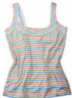
Tílko | Top ELEMENT 20.77190.0266