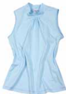
Tričko I T-Shirt ELSA 20.77191.0252