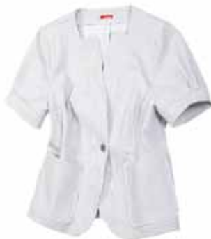
Sako | Jacket EMA 20.73065.3956