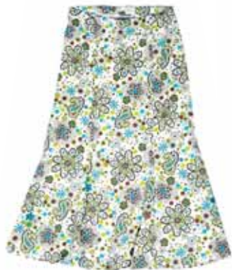
Sukně | Skirt CAPELINI 20.75085.0185