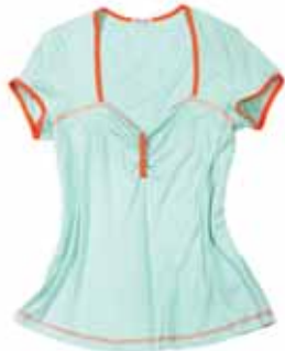
Tričko | T-Shirt ELIS 20.77192.0068