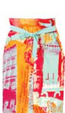
Sukně | Skirt EAGLE 20.75098.5391