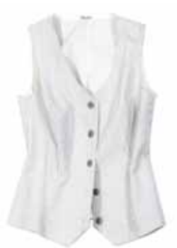
Vesta | Waist ENKORE 20.71012.3956