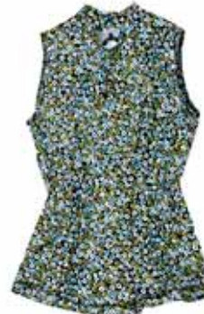
Tričko | T-Shirt ELSA 20.77191.0258