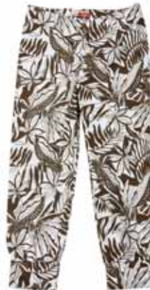
3/4Kalhoty I Shorts EDEN 20.72151.0262