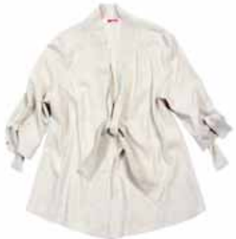
Kabátek | Spencer EMINENCE 20.73066.01242