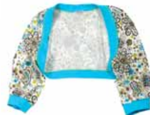
Bolerko | Bolero EARN 20.71013.0185