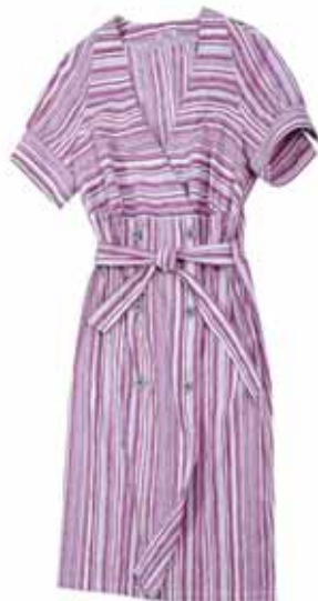
Šaty | Dress ELLA 20.76057.0259