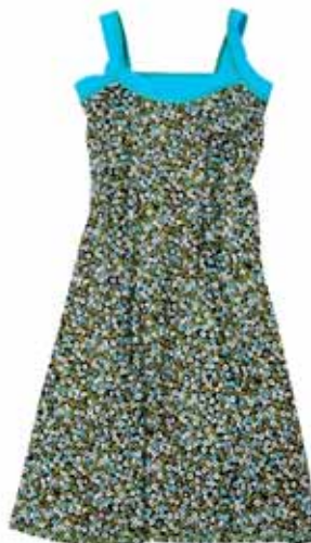
Šaty | Dress ELISE-K 20.76056.0258