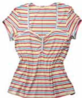
Tričko | T-Shirt ELIS 20.77192.0267

Sako | Jacket EMA 20.73065.5393 Tričko | T-Shirt ELIS 20.77192.0251 3/4Kalhoty | Shorts EDEN 20.72151.1931