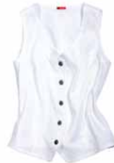
Vesta I Waist ENKORE 20.71012.01241