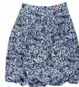
Sukně I Skirt EARNEST 20.75101.0256