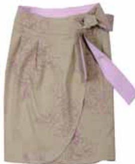
Sukně | Skirt EAVIS 20.75100.0066