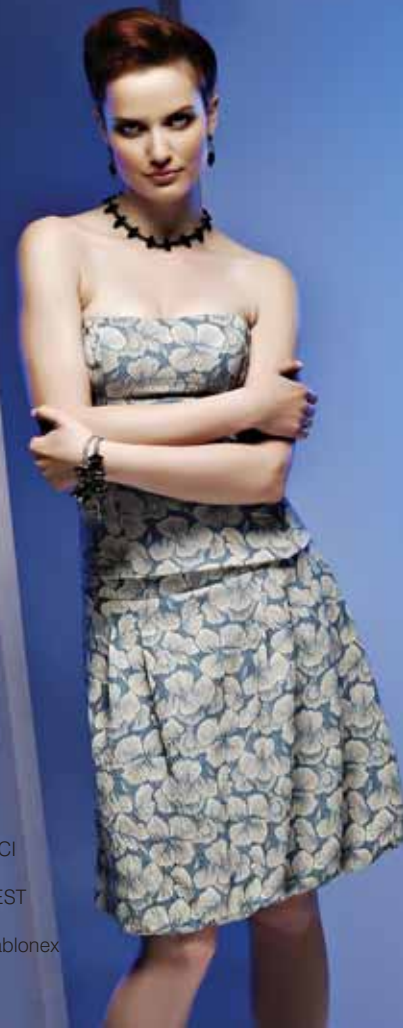
Korzet | Korset DERICI 20.77180.0263 Sukně | Skirt EARNEST 20.75101.0263 Šperky | Jewellery Jablonex