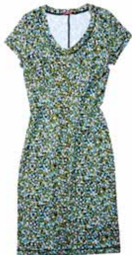
Šaty | Dress LEES 20.76060.0258