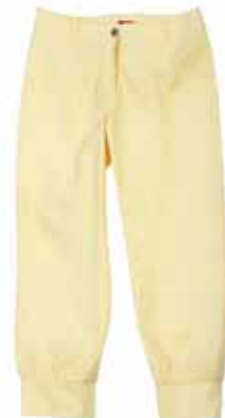
3/4Kalhoty | Shorts EDEN 20.72151.1934