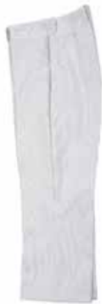
3/4Kalhoty | Pants CASTANGA 20.72145.3956