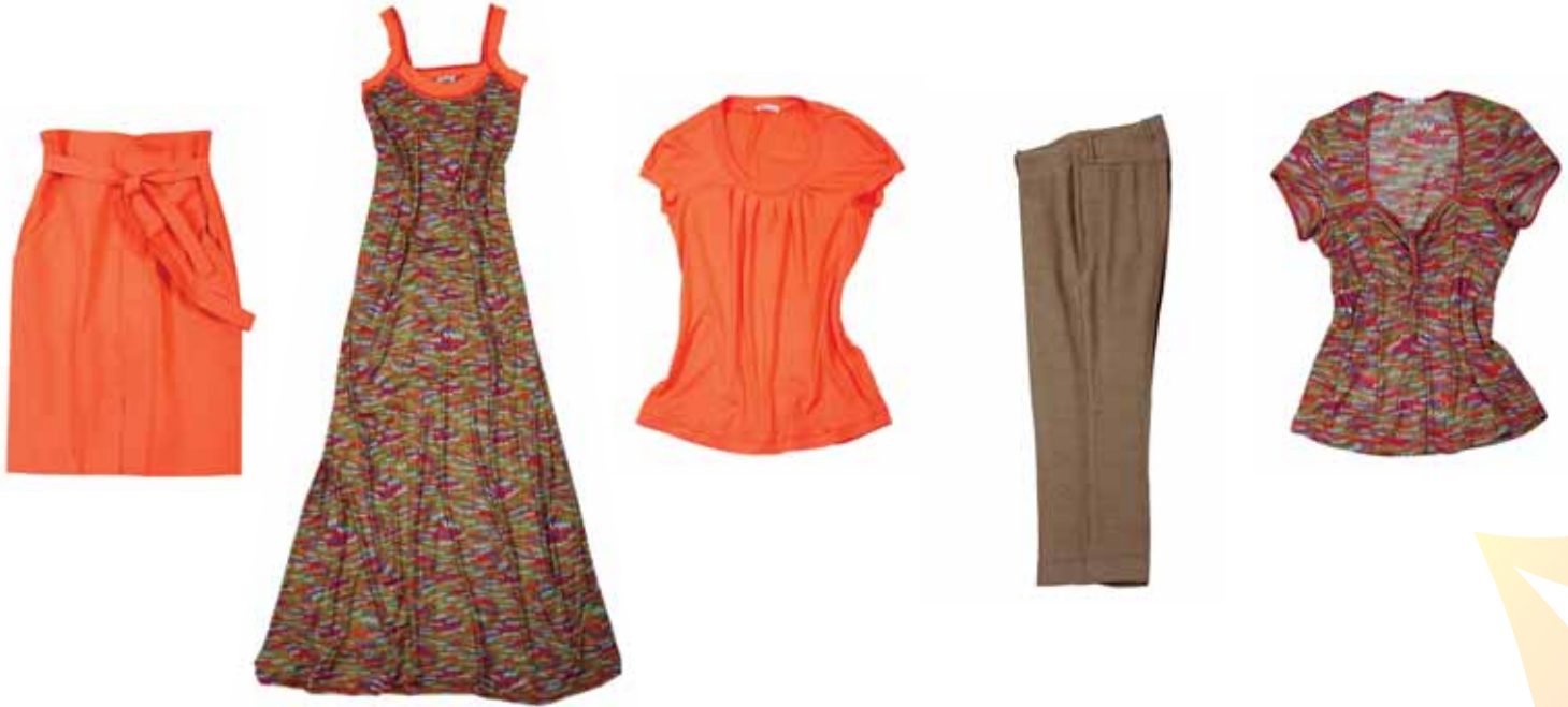
Sukně | Skirt EAGLE 20.75098.1932

The spring and then summer is coming, we lay off coats and reveal various remains of Christmas. Rather than listening to white lies your friends are telling you, you should choose the right clothes. Women with imperfect body appreciate jacket „Spencer“ that makes troubled body parts almost invisible. The effect of binder on front parts and on sleeves gives it an elegant look that can also appreciate expecting mothers. I wish all nice summer with clothes by Rialto.