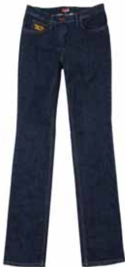
Jeansy | Jeans DREAM 19.72148.01763