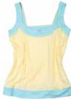
Tílko | Top ELEMENT 20.77190.0065