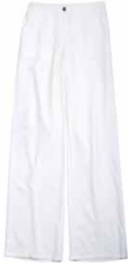
Kalhoty | Trousers CAMPUR 20.72144.01241