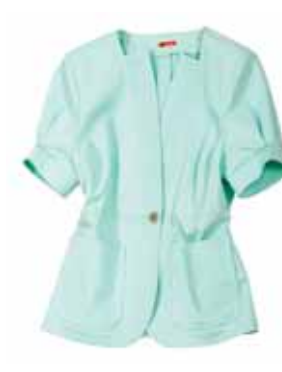
Sako | Jacket EMA 20.73065.1931