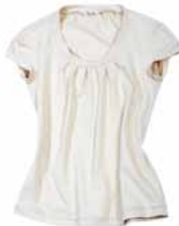
Tričko | T-Shirt ELLEN 20.77189.0250