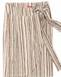
Sukně | Skirt EAVIS 20.75100.0261