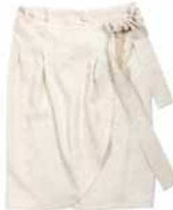
Sukně | Skirt EAVIS 20.75100.01242