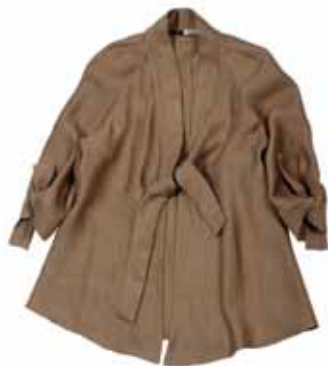
Kabátek | Spencer EMINENCE 20.73066.0255