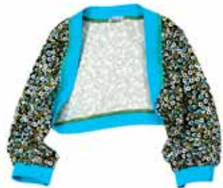
Bolerko | Bolero EARN 20.71013.0258