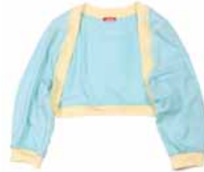
Bolerko | Bolero EARN 20.71013.0068