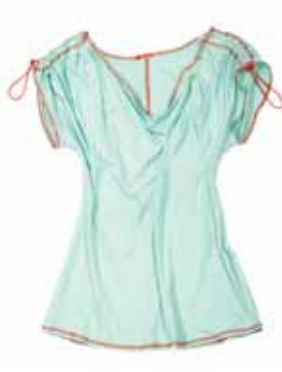
Tričko | T-Shirt ELBRA 20.77193.0068