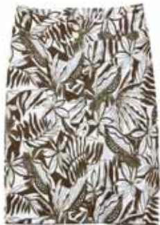
Sukně I Skirt BARSY 20.75103.0262

Glass jewellery will be used less this summer. But it will be big, dominant pieces. It's all about massive bracelets or their multiple layering, extravagant earrings (up to 15 cm long) or showy rings. Water and air are crucial inspiration for the summer season. Colours represent weightless airiness and gradate into super neutral shades – crystal, grey and white opal. We will also use natural shades of copper, amber, brown ebony, intensive red and blue opal.