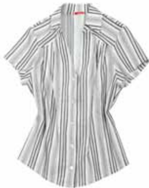
Halenka | Shirt ECLIPSE 20.77188.5427

Fancy mixture of sandals in earthy colours matches perfectly thanks to its creative details with light summer clothing. These shoes can be worn not only in hot city streets but also for evening walks. Are you afraid that you will have to suffer for beauty? You don´t have to. On the contrary, I tried that you fully enjoy your summer, especially with joy.