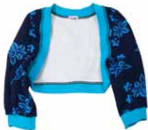
Bolerko | Bolero EARN 20.71013.4106