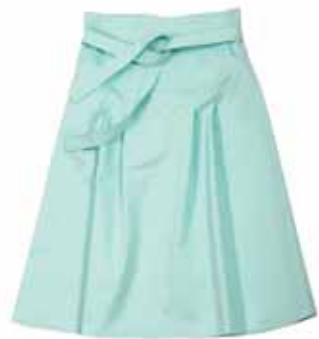
Sukně | Skirt EASTON 20.75099.1931