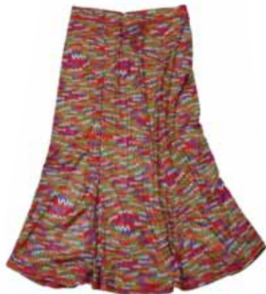
Sukně | Skirt CAPELINI 20.75085.0265

Tričko | T-Shirt ELBRA 20.77193.0265 3/4Kalhoty | Pants CASTANGA 20.72145.0255 Boty | Shoes Baťa