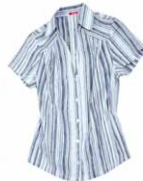
Halenka | Shirt ECLIPSE 20.77188.0260