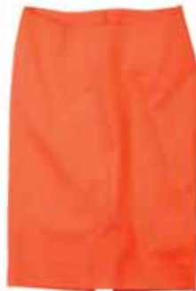
Sukně I Skirt BOIRY 20.75102.1932