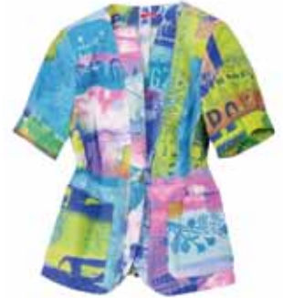
Sako | Jacket EMA 20.73065.5393